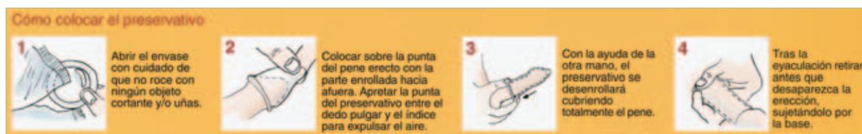
Colocación del preservativo masculino