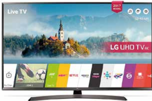
TV LED 43" LG 43UJ634V 4K UHD HDR Smart TV