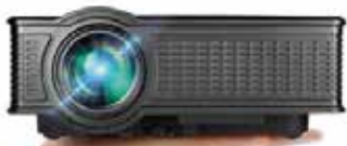
Proyector LED La Vague HD171 VGA Wi-Fi

* Los premios podrán sufrir variaciones según disponibilidad.