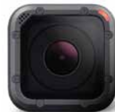
GoPro Hero5 Session 4K WIFI Bluetooth