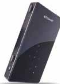
Proyector Polaroid DLP WiFi